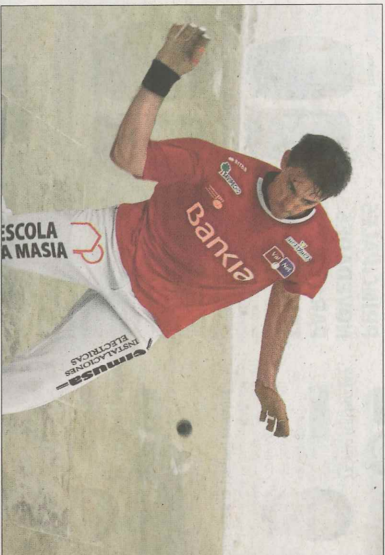
Soro III tiene una cita hoy en Pelayo.

La segunda cita de semifinales será mañana en Guadassuar,