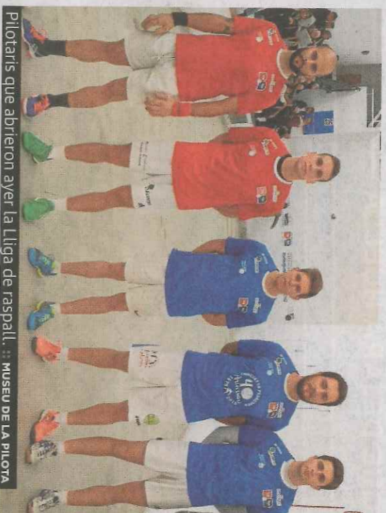
Pilotos que abrieron ayer la Liga de raspall.

En esa instalación, sostenida durante muchos años por Caixa Sagunt, se disputaron 18 finales del Individual. Allí se coronaron Genovés, Álvaro, Sarasol I y Grau, el úni-