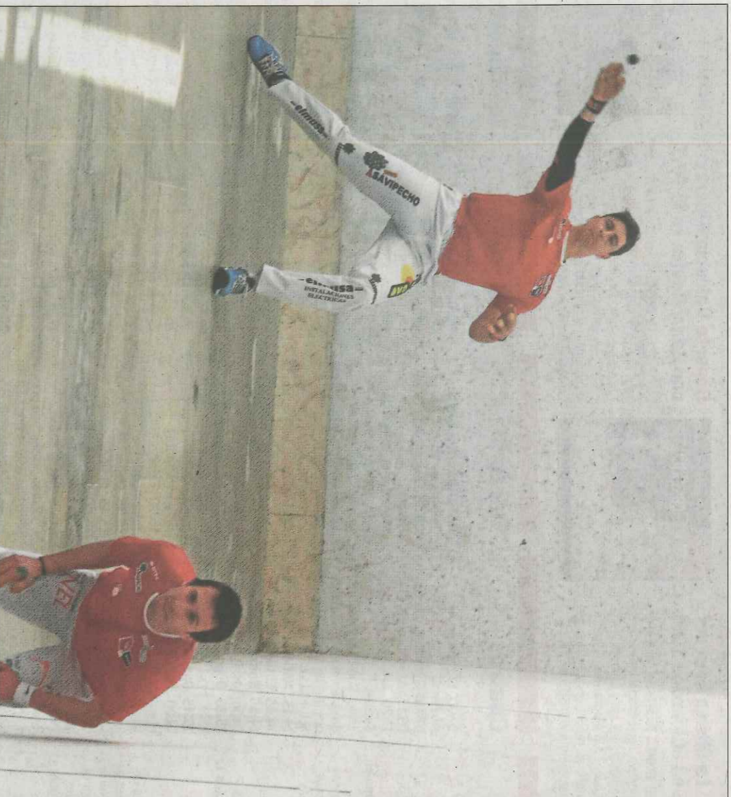
El trinquet Pelayo de Valencia va tancar ahir una exitosa setmana de pilota amb la final del trofeu de Falles. VN