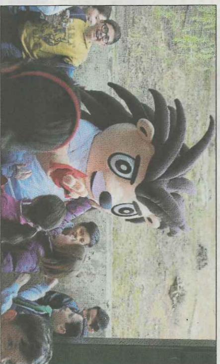
La mascota de la FPV, Mapi, va fer les delícies dels més menuts. FPV

«Actes com el de hui contribueixen a que l'esport de la pilota tinga més rellevància entre els xiquets i les xiquetes», va dir la màxima responsable del Tierno Galván. Per a l'alcalde de Godelleta, gràcies a la pilota valenciana, «en comarques castellanoaragoneses com aquesta, es promociona l'ús del valencià d'una forma natural». «Només cal entrar al carrer de go-