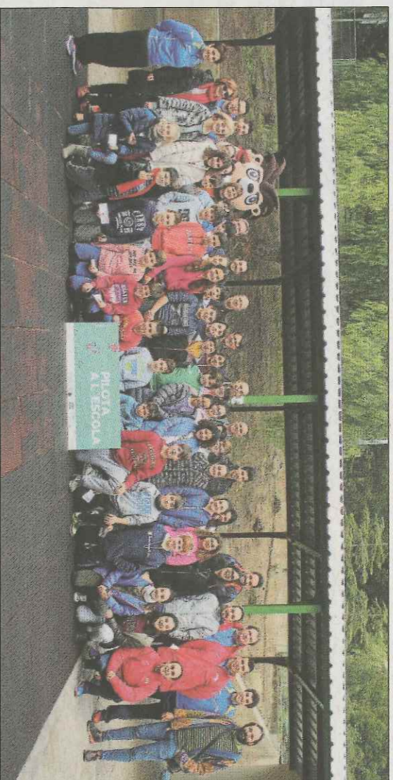
Les autoritats amb els protagonistes del programa, els xiquets i xiquetes de les escoles.

► La nova mascota de la Federació, Mapi, s'estrena en un centre educatiu amb la promoció de la pilota