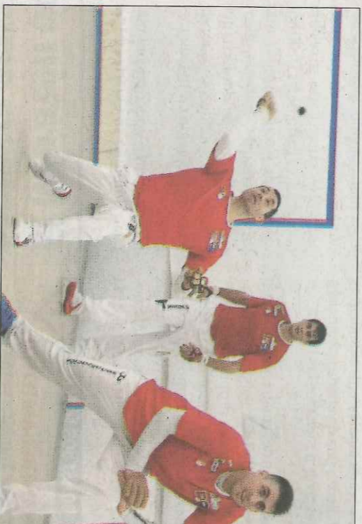
Demà a Muria s'ho juguen tot els equips de Puchol II i Genovés II. VN