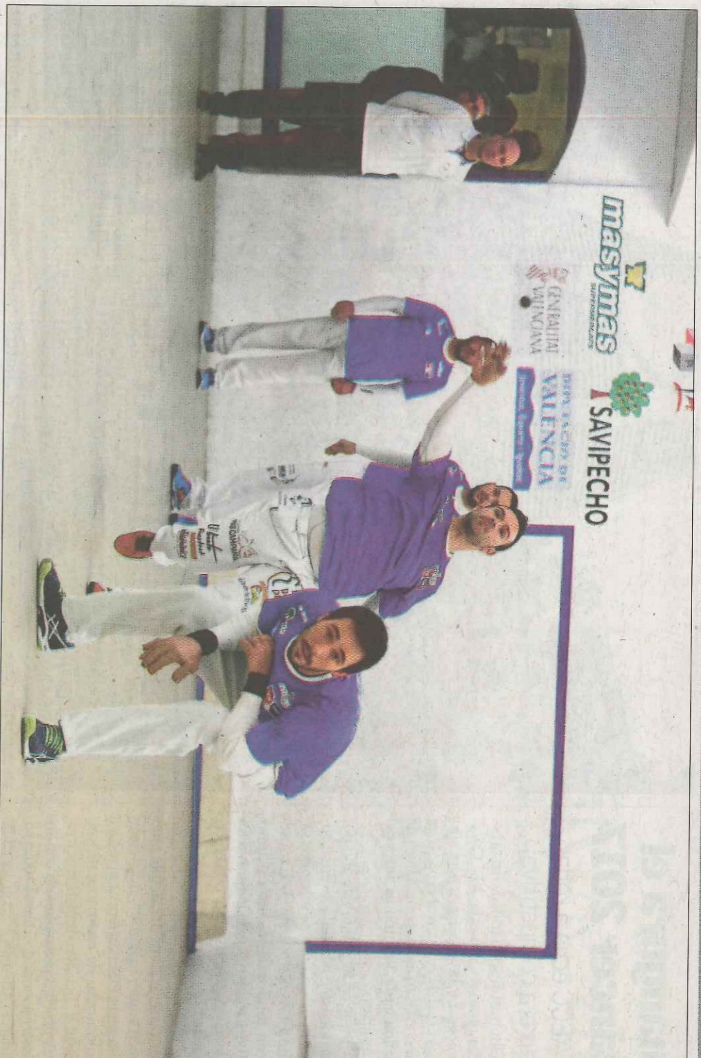
Els tríos de Benidorm i València juguen esta vesprada a Pelayo amb la classificació per a jugar les semifinals en joc. VN