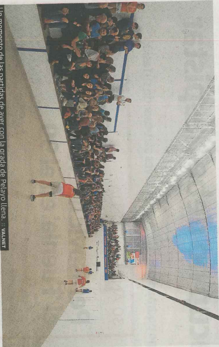
Un momento de las partidas de ayer con la grada de Pelayo llena.