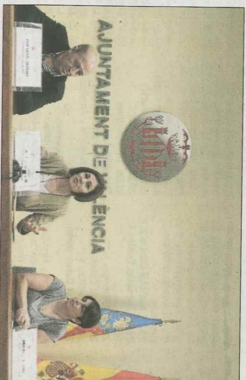
Presentació de la Setmana de la Dona. SP

La Setmana de la Dona, que s'inaugurava ahir amb magnífica en el Trinquet de Pelayo, es presentava hores abans en la sala de premsa de l'Ajuntament de Valen-