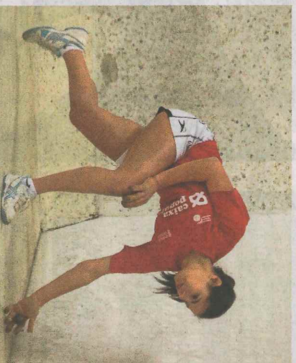
Mar de Biorcorp raspa una pelota. :: FPV