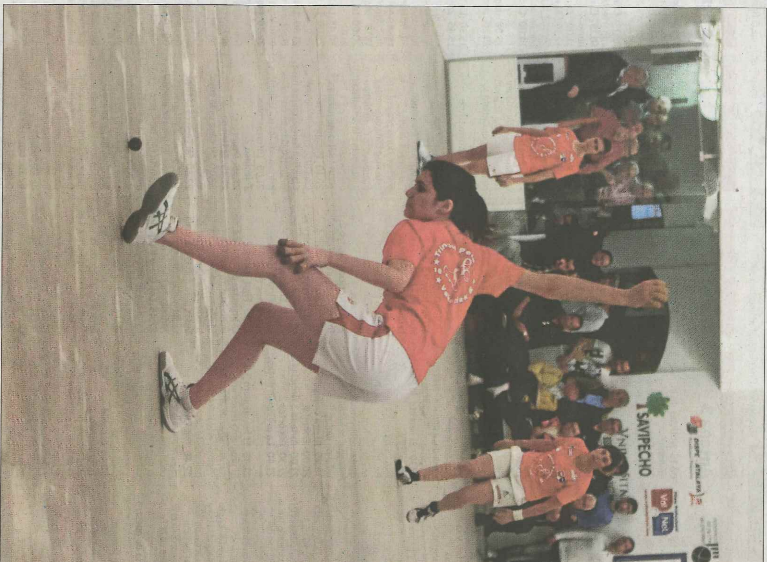
El trinquet Pelayo ha programat un trofeu de raspall femení en la seua 'Setmana Fallera'.

Altre punt a destacar en la Setmana de la dona és la disputa d'un Trofeu de Falles femení, també en la modalitat de raspall. Es completarà