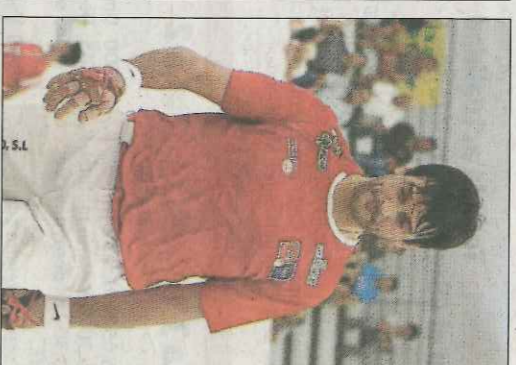
Genovés II. VM

A més a més, durant l'esmentada setmana, les dones accedirán de manera gratuïta a tots els trinquets habituals en l'oferta professional. En ellistar facilitat per la Federació no apareixen dos dels més rellevants, els de Massamagrell i Pedreguer. Però sembla que ha sigut una distracció perquè este diari va concloure amb els dos trinqueters, que asseguraren que sí que donen suport a esta iniciativa.