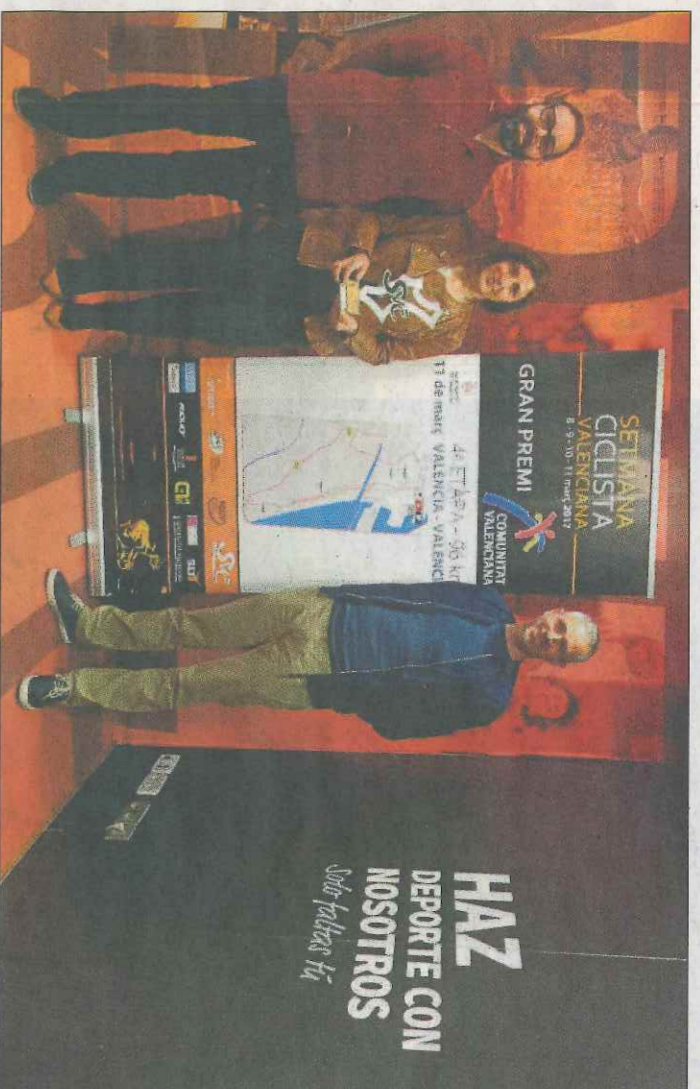
Presentación de la Semana Ciclista Valenciana. E.M.