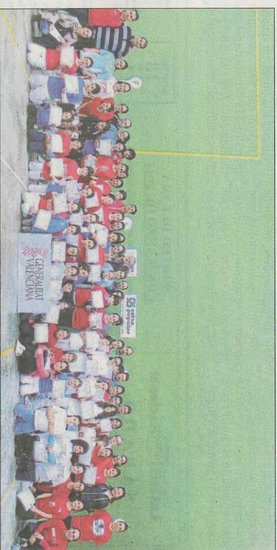
El número de niñas inscritas en los Jocs Esportius crece cada año y ya roza la cifra de 400.