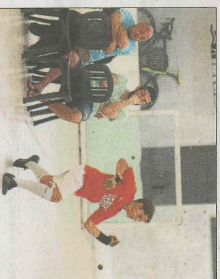
El consejo de los monitores y técnicos es clave en la formación de los jugadores. FEDPIVAL