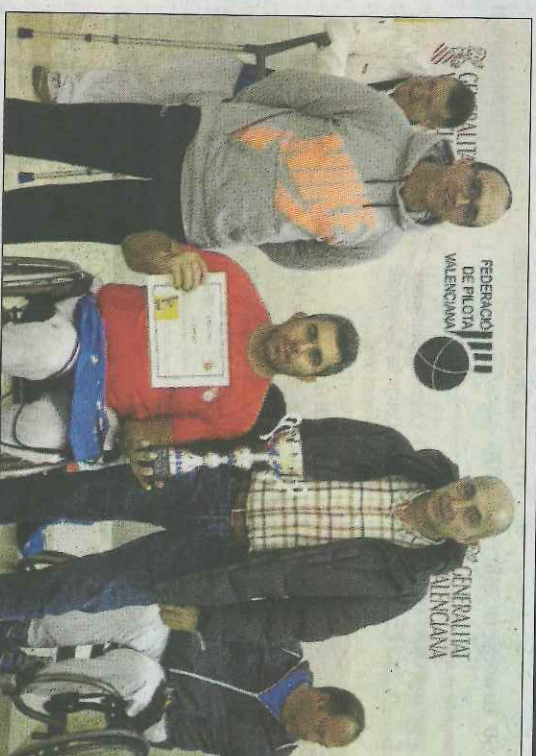
Moment del lliurament de trofeus ahir en el trinquet d'Orba.