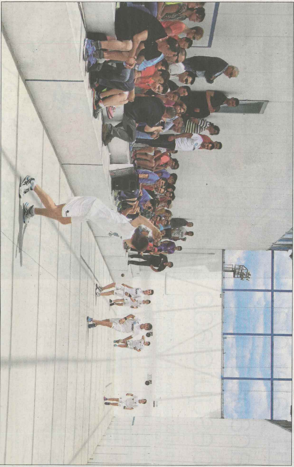
El raspall es una de las modalidades con un mayor número de participantes individuales y por equipos.