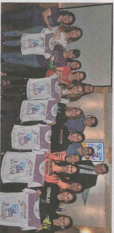
Corredoras posan ayer con la camiseta de la 10K femenina.