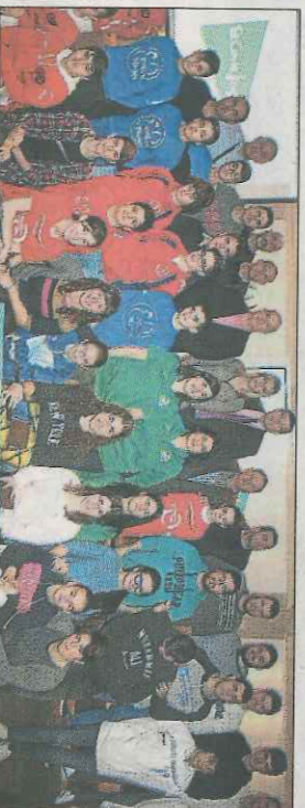
El Corte Inglés 2017 va donar el tret d'inici al dimecres. FPV

Al voltant de seixanta seran les formacions que juguen en les categories de carter, mentre que les escoles han presentat quasi altres tants. La competició de trinquet tindrà més 50 equips, sent la principal novetat del torneig la creació d'una categoria femenina. En ella les xiques dels clubs de la Pobla de Vallbona, amb quatre formacions, Godelleta, Borbotó i Meliana seran les pioneres en participar dins una