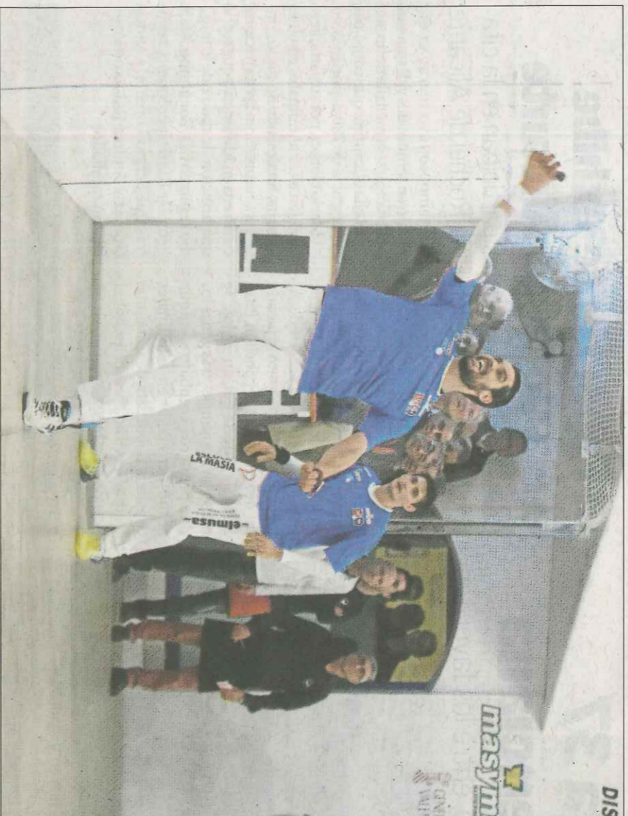
Soro III i Javi han començat guanyant la primera partida de Lliga. Hui Soro juga a Vilamarxant. VN