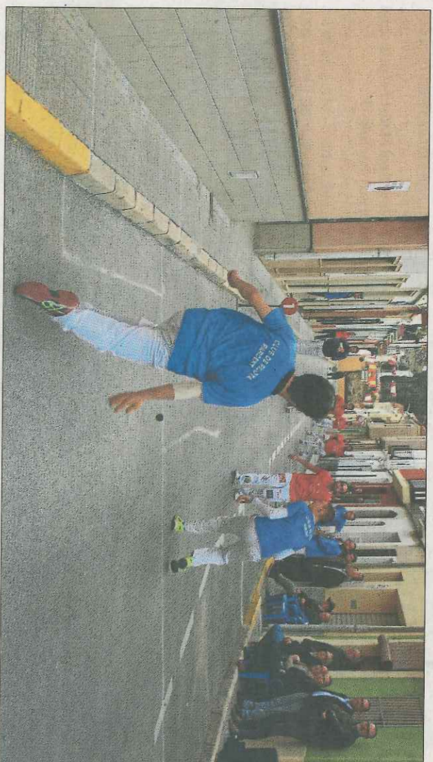
Parcent es va proclamar campió de la Supercopa de Rattles en la última final a Pedreguer.