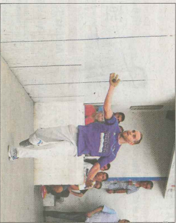
Moncada jugarà la seua primera final en la màxima categoria.