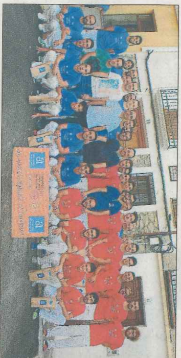
En les finals de l'any passat Parcent va iniciar un cicle espectacular. FPV

en Poble Nou de Beniatxell es jugarà la final de la Copa GVA.