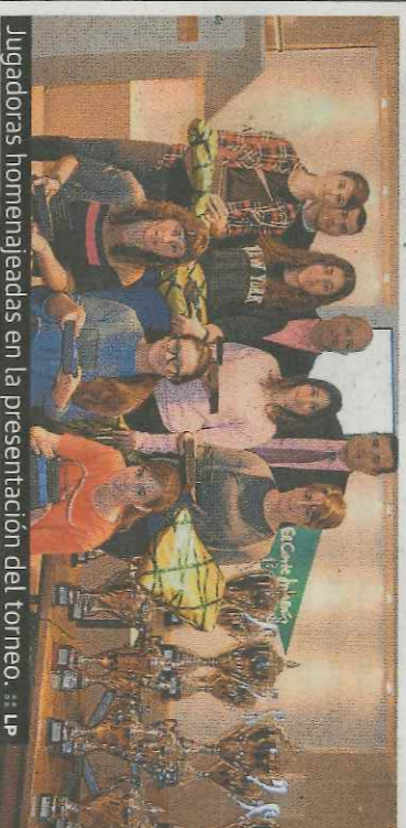
Jugadoras homenajeadas en la presentación del torneo.