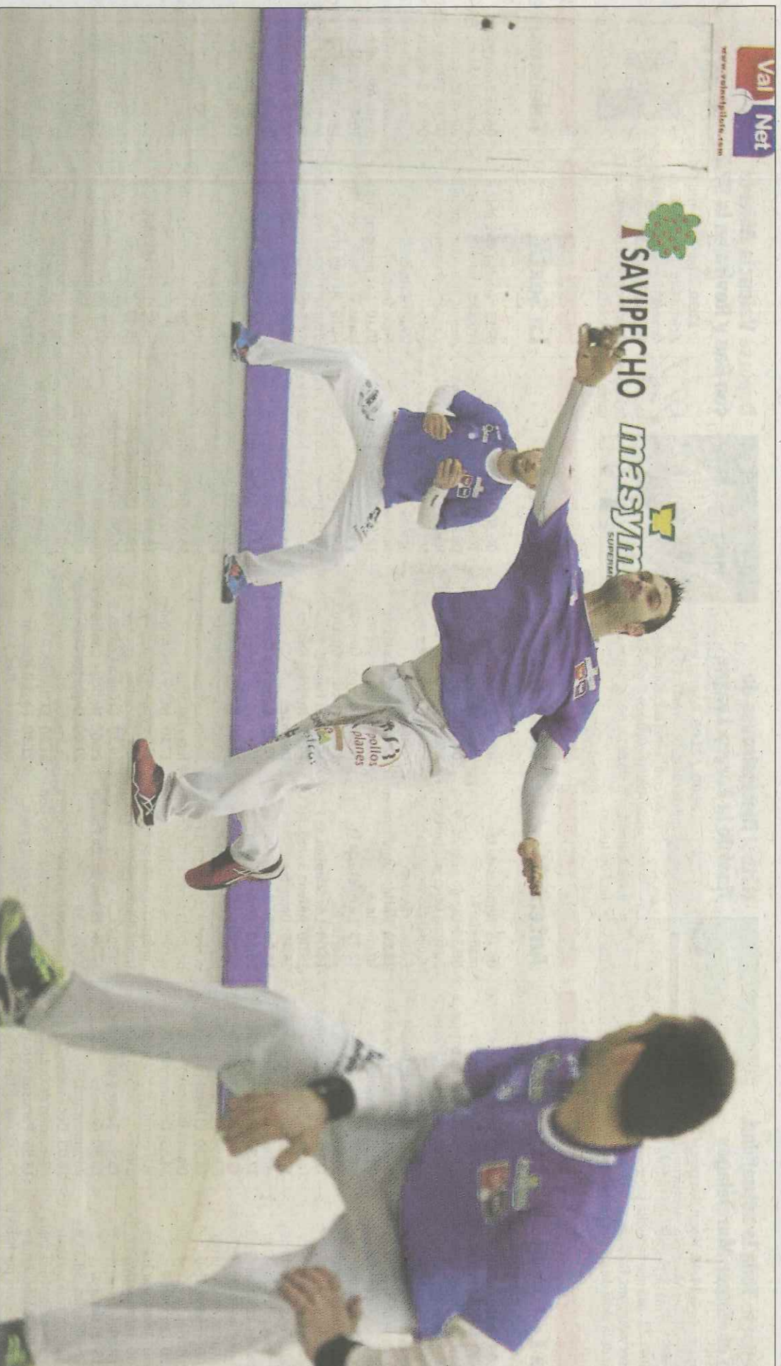
El trio representatiu de València, ahir en el trinquet de Guadassuar.