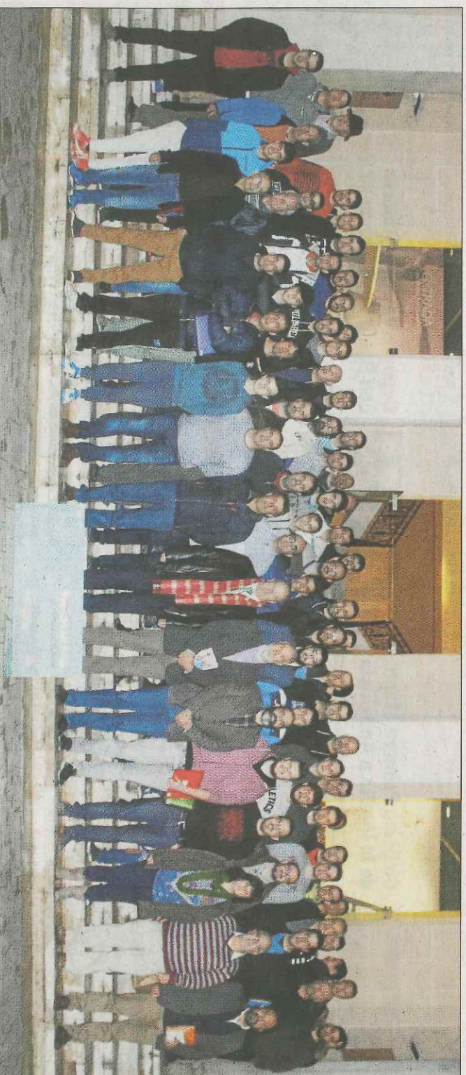
Imatge de l'acte de presentació del Trofeu Diputació d'Alacant de ratlles. SP