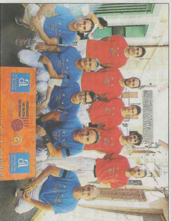
Arranca el Trofeu Diputació d'Alacant de ratlles.