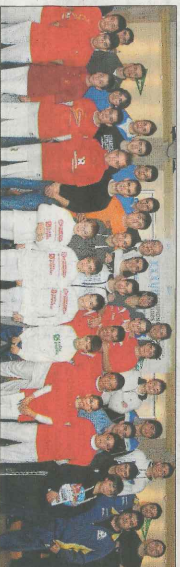
El Campionat Autnòmic de Galotxa, Trofeu El Corte Inglés, comença hui. SP

Enguany les instal·lacions de Godella (campionat de carrer), Torrent (categories de trinquet) i Valnassa (competició d'escoles) han estat les escollides per a acollir les