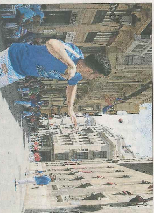
La piñota volverá al carrer. Cavallers. MIQUEL NAVARRO

los pueblos, con sus bandas de música, ofrecieron un espectáculo impresionante que dignificaba el Joc de Piñota. A ellos hay que añadir, en el capítulo de satisfacciones y novedades, los diez equipos de las comarcas centrales, que parecen recuperar las ilusiones por esta especialidad. Ahí está el ejemplo de Mercat Central, Cap i Casal, Llanera Montserrat, Alhara del Patriarca, Caixa Popular Meliana, D'Altea, pioneros en aquellas competiciones que revitalizaron la modalidad que practicaron los grandes genios del XIX, glosados en crónicas periodísticas que hablaban de miles de personas en desafíos relumbrantes.