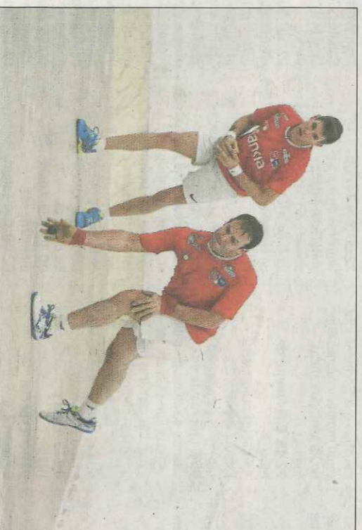
A Moltó li va costar ben poc acceptar el repte. VN

Ningú ha tingut problemes en desvelar com afrontaran la partida. Pel bandol dels rests, Ian jugarà darrere quan ocupen el dau mentre que al rest canviaran les posicions. «Tinc prou confiança i inclús m'agrada jugar davant quan estic en la part del dau. És una cosa que ve dels entrenaments de l'indivi-