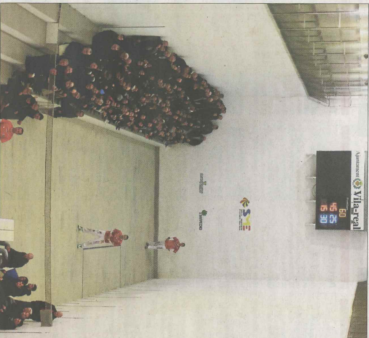
El trinquet de Vila-real acollirà en la nit d'este divendres la primera partida de la fase regular. ▼▼

Les partides es disputaran durant el cap de setmana, complint