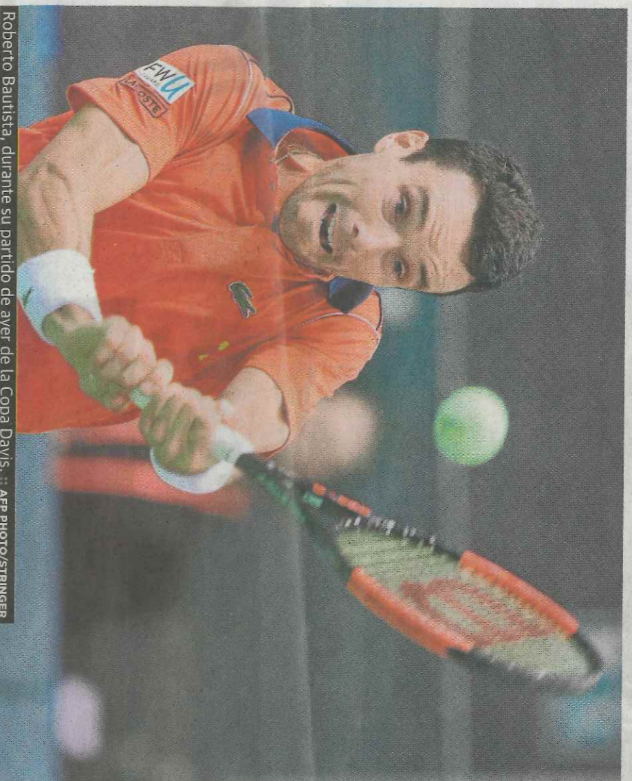
Roberto Bautista, durante su partido de ayer de la Copa Davis.

Con muchos huecos en la grada y una pareja llena de españoles, el asturiano se adelantó en el partido, al llevarse el primer set. El croata empezó a conectar derechas certeras a las líneas, lo que le valió para llevarse los dos siguientes sets. El