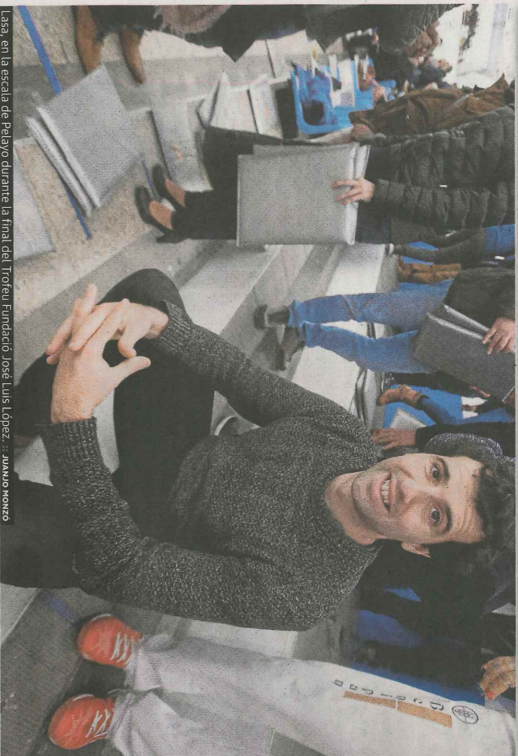
Lasas, en la escuela de Pelayo durante la final del Trofeu Fundació José Luis López.

Siempre pide el café igual. «Me gusta solo y sin azú- car», afirma. Lo toma des- pués de la co- mida.