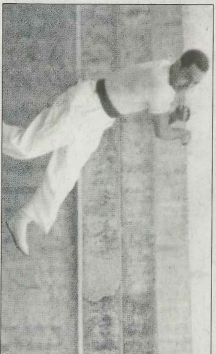
Quart «fent el dau» durante una partida.

vencieron en pruebas de lucha individual. Quart y Genovés fueron capaces de jugar contra tres rivales a la vez. ¿Se imaginan que Fe-