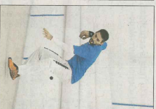
Soro III. VM

modalitats, Lliga, Copa i Campionat Individual. També seria problemàtic per a quadrar dates per als diferents trofeus de curta durada que s'organitzen al llarg de tot l'any. La decisió no s'ha d'allargar en el temps pel bé de tota la temporada. Són dies claus per a decidir quin serà el futur de la pilota valenciana en les seues dues modalitats professionals, escala i corda i raspall. Hui es resoldran molts dubtes i tot, quan també s'espera la definitiva posada en funcionament de la Fundació. En principi s'espera per a mitjan març.