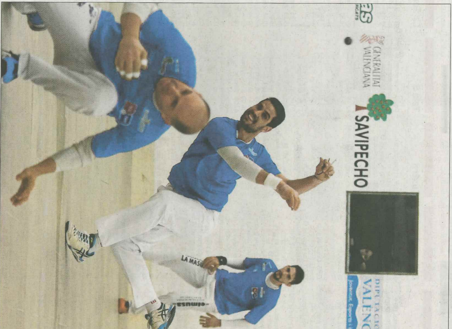
Els pilotaris de raspall i escala i corda han d'eleger el model de gestió de la pilota professional. VM

El que està clar és que allargar en el temps la decisió final seria problemàtic per a reestructurar tota la temporada, especialment les tres competicions oficials en les dues