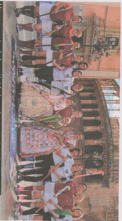
Un momento de la actividad en el centro de Valencia. :: LP

BALONMANO FEMENINO :: R. D. Las chicas del Canyameler Valencia perdieron ayer ante el BM Porriño por 21-25. Las valencianas sucumbieron ante un rival que viajó en los vagones de la parte alta de la tabla y que sin despejar tuvo el partido bastante controlado. La semana que viene, el Rocas es un rival casi imposible.