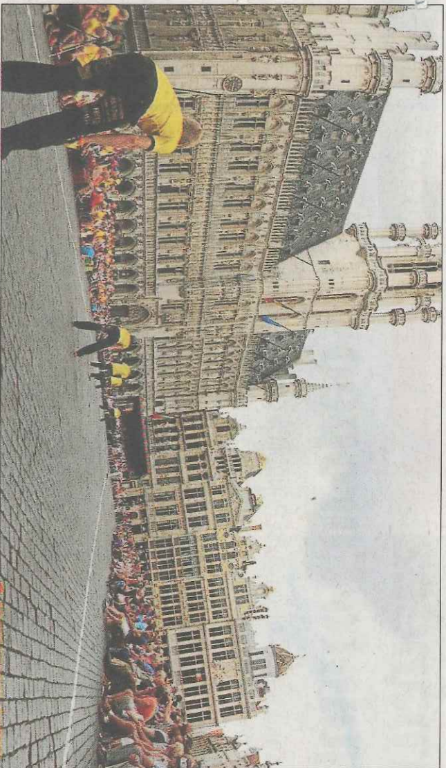
Partida de llargues en la Gran Place de Bruselas.