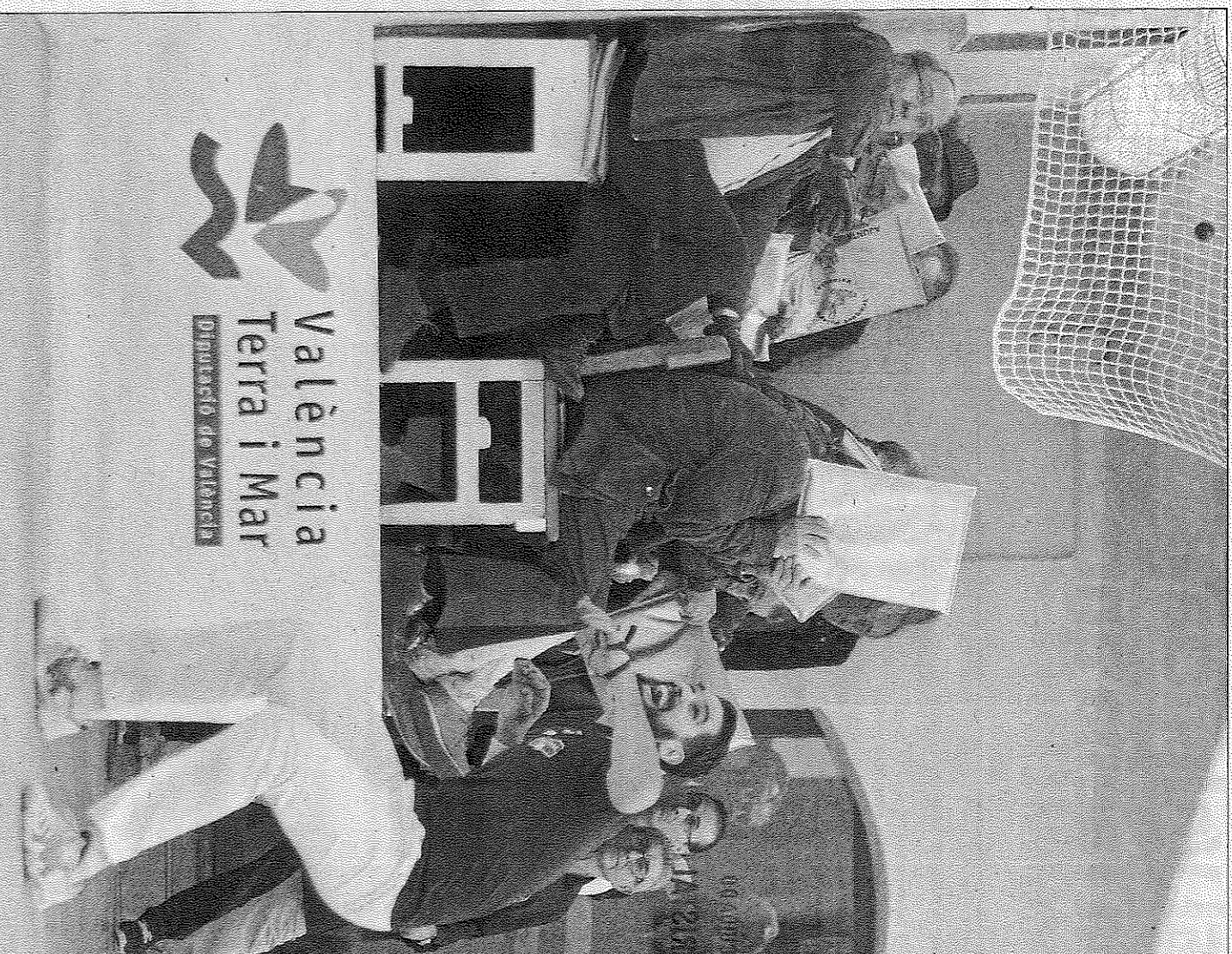
Un grupo de espectadores se protege en la parte del dau del trinquet. GERMAN CABALLERO

Liberty Media, nuevo propietario de los derechos del Gran Circo, le ha ofrecido el cargo de presidente de honor. «Fui despedido. Simplemente me he ido, es oficial. Ya no soy el líder de la compañía, mi puesto lo ha tomado Chase Ca-