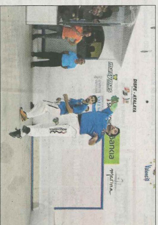
Monrabal no podia faltar en un trofeu en sa casa. VN

Des de Vilamarxant atorguen que volen implicar als assistents en la realització d'un 'mannequin challenge'. Per als que no estiguen posats en els fenòmens virals, es tracta de gravar un vídeo amb els protagonistes immobils, simulant una escena congelada.