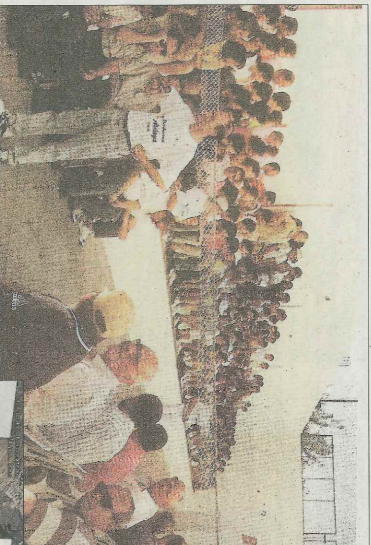
El nuevo Trinquet de San Juan, inaugurado en 1996.

Cuando llegó a San Juan, tras atravesar la Pampa en ferrocarril, su decepción por el paisaje: «Acó pareix La Rioja», dijo. Y estuvo a punto de hacerle regresar a la verde de Buenos Aires. Esperando el tren de vuelta oyó hablar su lengua. Se le abrió el corazón. Se dirigió emocionado a los que en el idioma de su madre se expresaban y le hablaron de un trinquete donde jugaban y hacían vida social. No tomó el tren de regreso. Allí se quedó y se abrió camino como herrero artístico y viticultor. Acabó siendo uno de los socios fundadores