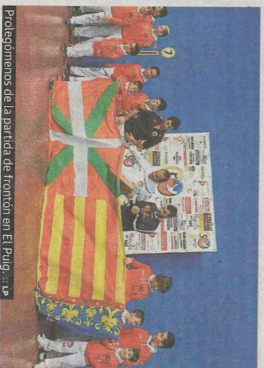
Prolegómenos de la partida de frontón en El Puig. :: LP