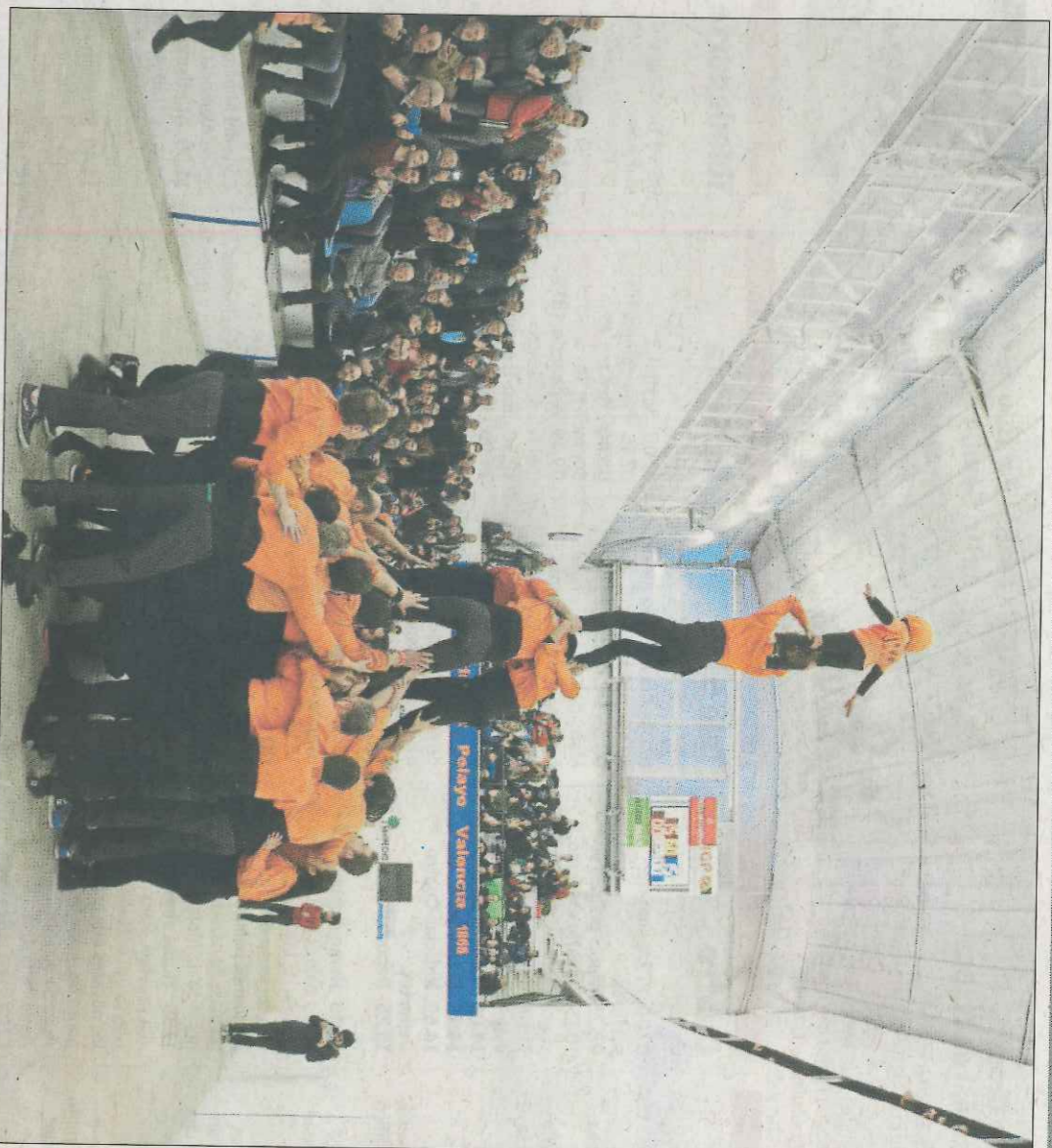
Palayo va ser ahir una festa amb motiu de la cloenda del Trofeu Mixt Fundació José Luis López.