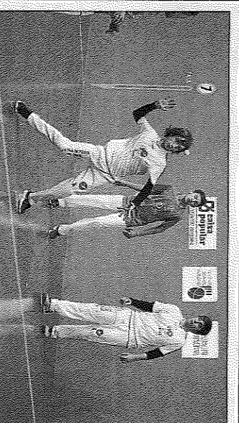
Les escoles del Puig i Vinalesa estaran en les finals. F.P.V.

El diumenge dia 22 de gener arrancarà una nova edició del Campionat Individual de Frontó al 4 i 1/2, després de l'èxit de la primera campanya de l'anys passat. Es tracta d'una modalitat que és disputa per seus per a que cada diumenge es pugui gaudir d'una bona jornada de pilota. Les seus que col·laboraran amb el campionat enguany són les d'Almussafes, Alfafar, Massalassar, Godella i Borbotó. S'allargarà fins el mes de març i participaran un total de 36 jugadors, dividits en 4 categories: 8 d'ells jugaran en primera, 12 en segona, 8 en 3ª i 8 en 3ªB.