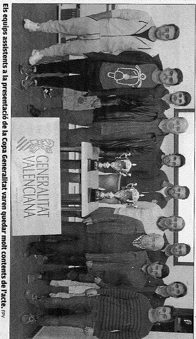
Els equips assistents a la presentació de la Copa Generalitat varen quedar molt contents de l'acte. F.P.V.

els primers son campions de palma, mentre que els de Morvedre defenen la Copa guanyada al 2016. Completarà la ronda de quarts l'enfrontament entre Parecent i Marquesat, on l'equip alacantí és favorit, ja que es el campió de la Lliga de Llargues i recent guanyador del Circuit La Bolata.