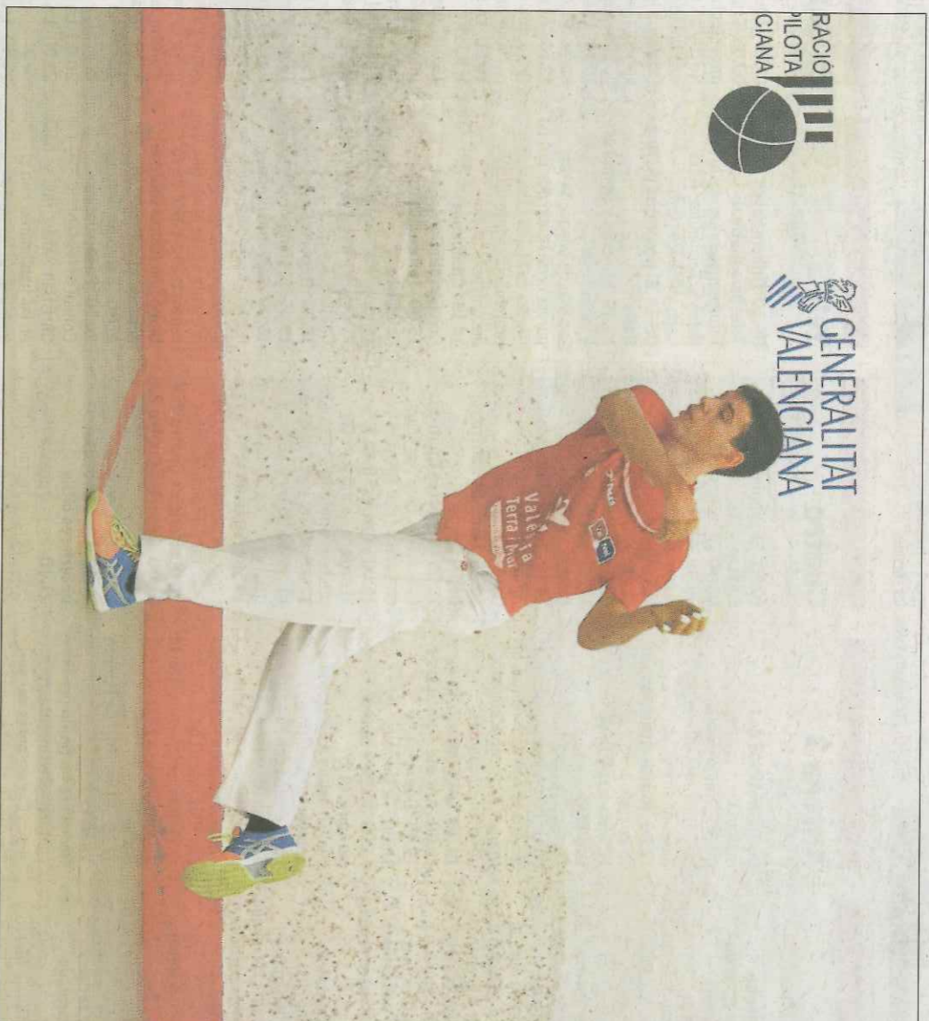
De la Vega té hui una partida dura davant Soro III, però és una gran oportunitat. WM

Per descomptat, fer oblidar a Puchol II hui a Vilamarxant no serà fàcil, però tots els números u sempre han començat entrant per la baixa puntual de la figura del mo-