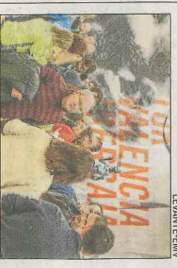
La Feria del corredor, ayer.